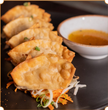
33 GYOZAS Empanaditas japonesas fritas, rellenas de pollo, cerdo y verduras.