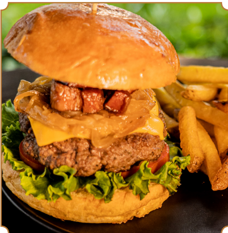
H DELUXE Hamburguesa H de 200gr., rellena de champiñones, pan brioche, salsa H, lechuga, tomate, cebollas caramelizadas y tocino glaseado. Acompañado de papas fritas artesanales.