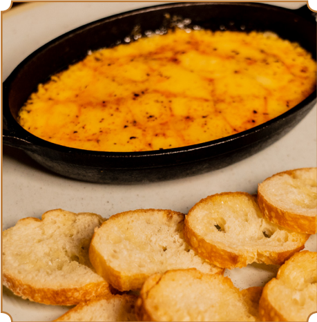
30 PROVOLETA Provolone fundido con especias de la casa.