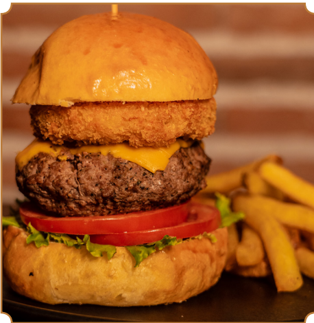
H DOBLE SMASHED Doble hamburguesa H, pan brioche, salsa H, lechuga, tomate, tocino crocante, y queso cheddar. Acompañado de papas fritas artesanales.