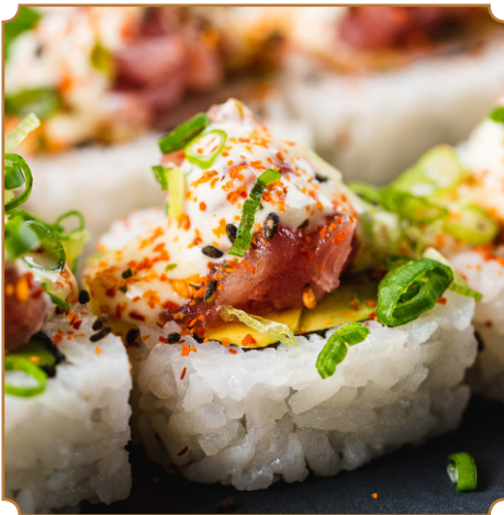
Tabla de makis 38 1/2 tabla 20

Ebi furai, palta, pescado, salsa acevichada y negi.