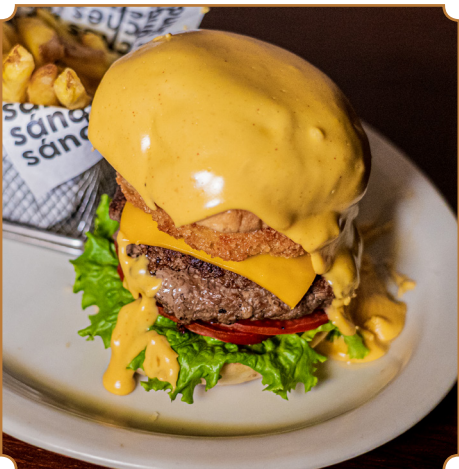
38 H CHEDDAR Hamburguesa H de 200gr., pan brioche, salsa H, lechuga, tomate, cebollas, relleno de queso cheddar, croqueta Mac & Chesse y extra cheddar. Acompañado de papas fritas artesanales.