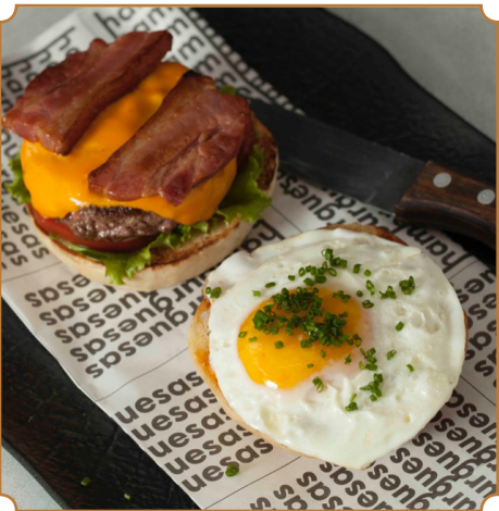
40 H AMERICANA SMASHED Hamburguesa H, pan brioche, Salsa H, lechuga, tomate, cebolla, queso cheddar, tocino crocante y huevo. Acompañado de papas fritas artesanales.