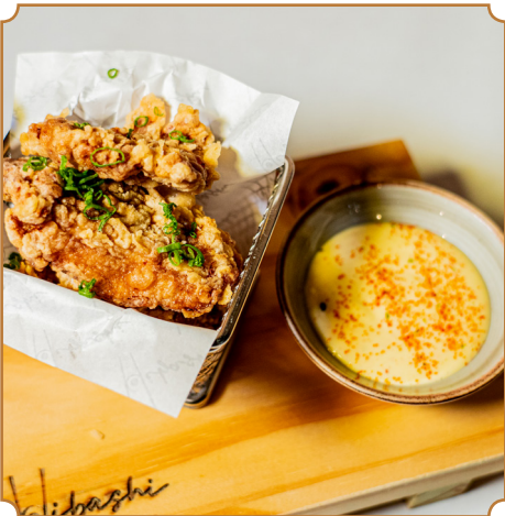
TORI KARAGUE Chicharron de pollo al estilo japonés, acompañada de salsa acevichada.