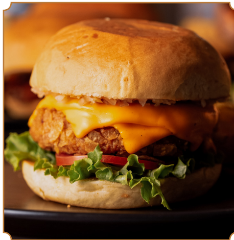
32 H CHICKEN Pollo crocante, pan brioche, salsa H, lechuga, tomate y queso cheddar. Acompañadas de papas fritas artesanales.