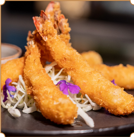
EBI FURAI Langostinos fritos empanizados al panko.